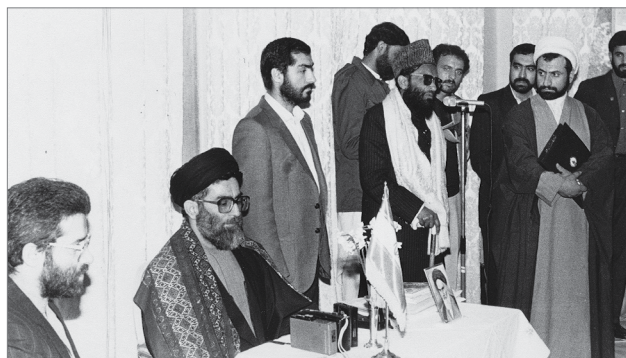
تصویری از سفر آیت‌الله خامنه‌ای به پاکستان | دی ماه ۶۴

یکی از خصوصیات اصلی رژیم پهلوی، فساد بود. فساد، فساد جنسی، فساد مالی، اعتیاد، ترویج اعتیاد و ترویج مواد مخدر صنعتی به وسیله‌ی عناصر اصلی حکومت آن روز در ایران به وجود آمد و اتفاق افتاد. پلیس سوئیس یکی از خواهرهای محترم‌ها را در فرودگاه سوئیس با چمدان پر از هر وئین، دستگیر کرد! [خبر آن در] همه‌ی دنیا پیچید، منتها زود ماستمالی کردند؛ خوب مربوط به خودشان بود؛ قضیه را بر طرف کردند، گره را باز کردند؛ یکچنین وضعیتی [بود]. ۹۳/۱۰/۱۷